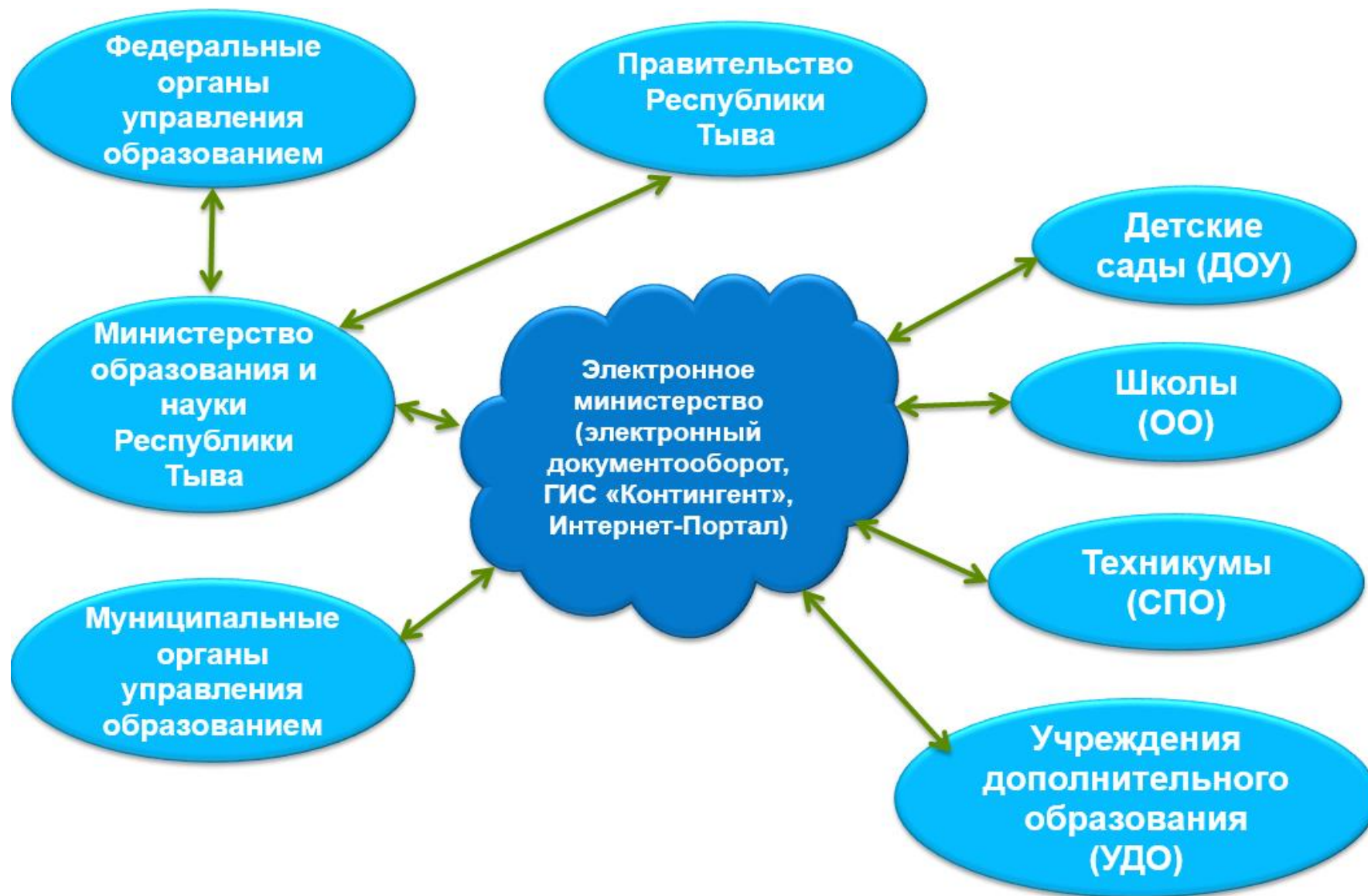
Рис.3. Электронное министерство: