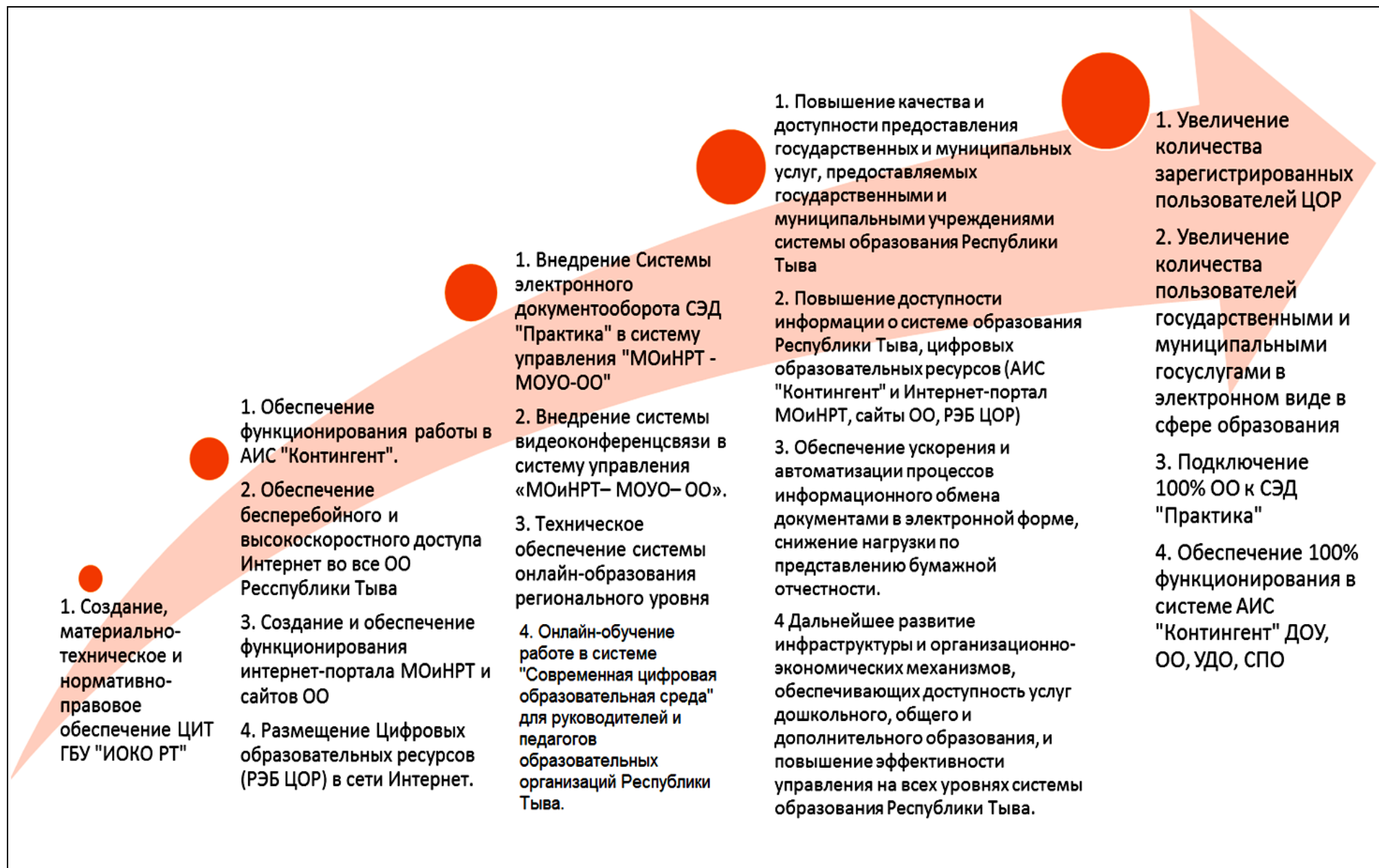
Рис.2. Изменение движения отчетности при реализации проекта «Электронное министерство»