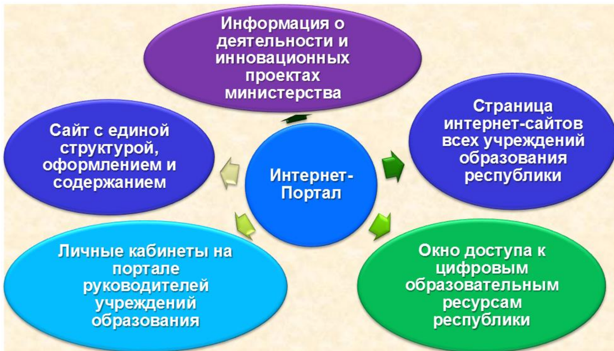
Рис.5. Центр информационных технологий, создаваемый в рамках проекта «Электронное министерство»: